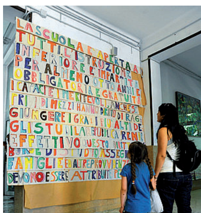
Universi paralleli Gli alunni della Paravia mostrano a mamme e maestre i loro disegni