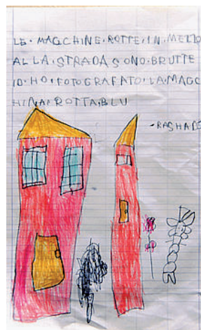
In mostra Alcuni dei disegni realizzati dai bambini a scuola