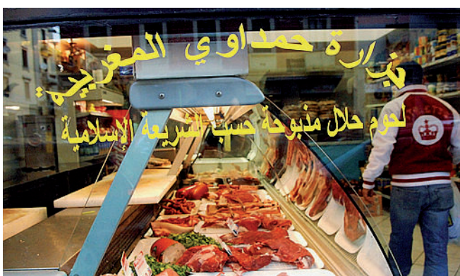
La strada. Sopra: la vetrina di una macelleria islamica. Nel tondo: immigrati alla fermata dell'autobus