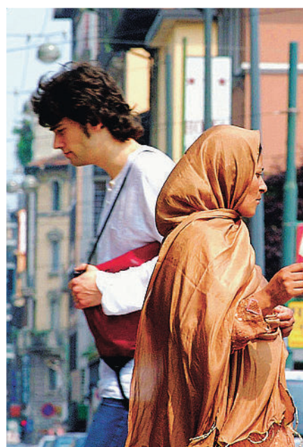
STRANIERI I giovani diffidano degli immigrati

E proprio in nome del dialogo, sempre ieri, il Gruppo consiliare dell'Ulivo ha organizzato a Palazzo Marino un convegno dal titolo «Giovani nella città, giovani nelle culture». Un incontro cui ha partecipato il ministro per le Politiche giovanili, Giovanna Melandri: «Tra i ragazzi di religioni diverse deve svilupparsi un confronto su temi concreti — osserva —. È quan-