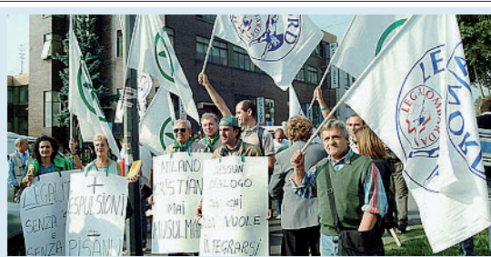
Il presidio Settembre 2005, Milano: la Lega Nord manifesta per chiedere la chiusura della scuola islamica di via Quaranta. A destra, i genitori degli alunni