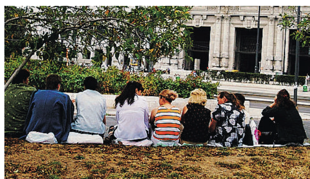
STAZIONE Il ritrovo delle donne dell'Est in piazza Luigi di Savoia

Le trovi alla stazione Centrale, proprio nel punto in cui il Comune propone di installare 500 telecamere di sorveglianza e tutti si affrettano a dire che ci vuole maggiore sicurezza. Sono le donne dell'Est che si concedono agli anziani come mogli in affitto. Ucraine attestate che paghi come badanti per accudire la casa ma, soprattutto il padrone di casa. Sono mezze colf e mezze geishe. Per disperazione, per fame.