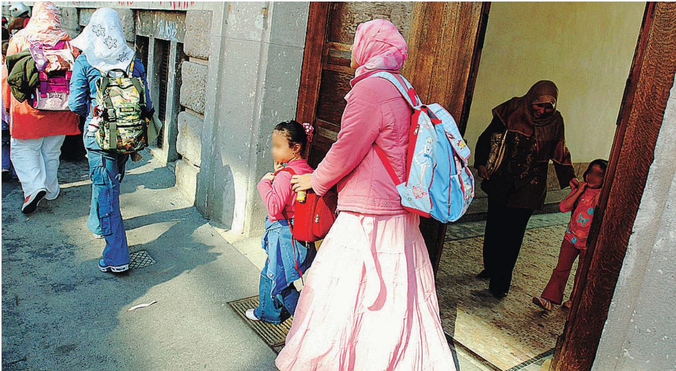
SICUREZZA Chiude dopo soli tre giorni la scuola araba di Milano: non è in regola con le norme di sicurezza e i responsabili sospendono le lezioni