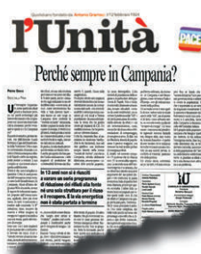
IL COMMENTO L'intervento su «l'Unità» di ieri