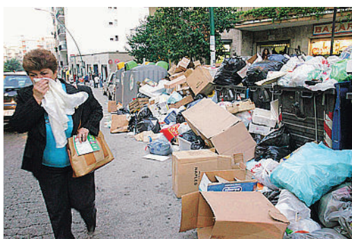
EMERGENZA Campania a rischio igienico per i rifiuti