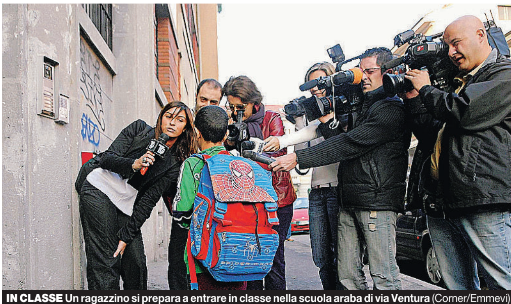
IN CLASSE Un ragazzino si prepara a entrare in classe nella scuola araba di via Ventura

Le ore settimanali di lezioni. Due di Corano