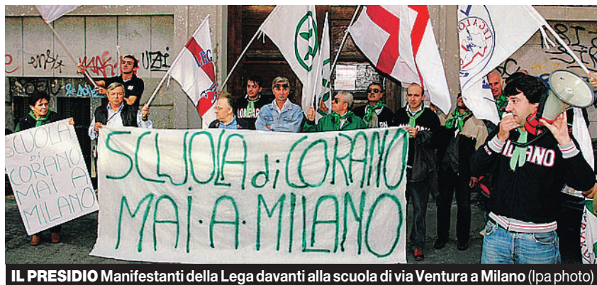
IL PRESIDIO Manifestanti della Lega davanti alla scuola di via Ventura a Milano